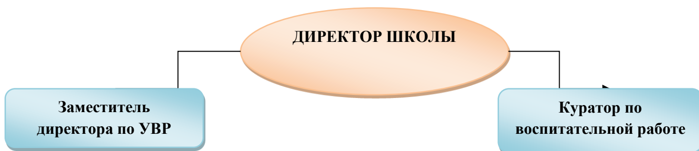
Схема управления школой